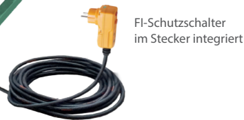
FI-Schutzschalter im Stecker integriert